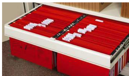
Cadre coulissant pour dossiers suspendus