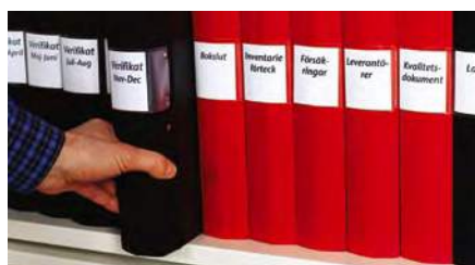
Rangement de classeurs