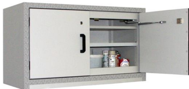
AF-180 Armoire sous paillasse